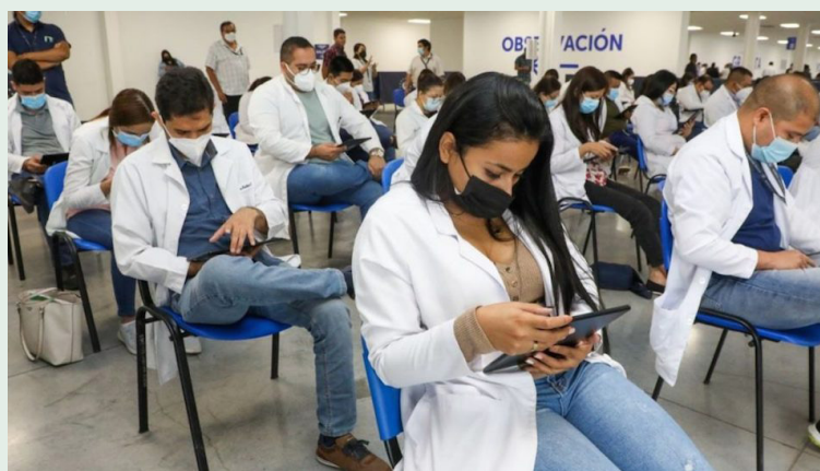
El Ministerio de Salud solo ha habilitado 84 plazas para el internado rotatorio y más de 200 estudiantes de medicina quedarían fuera.

Este año Ministerio de Salud (MINSAL) solo ha habilitado 84 plazas para el internado rotatorio y más de 200 que-