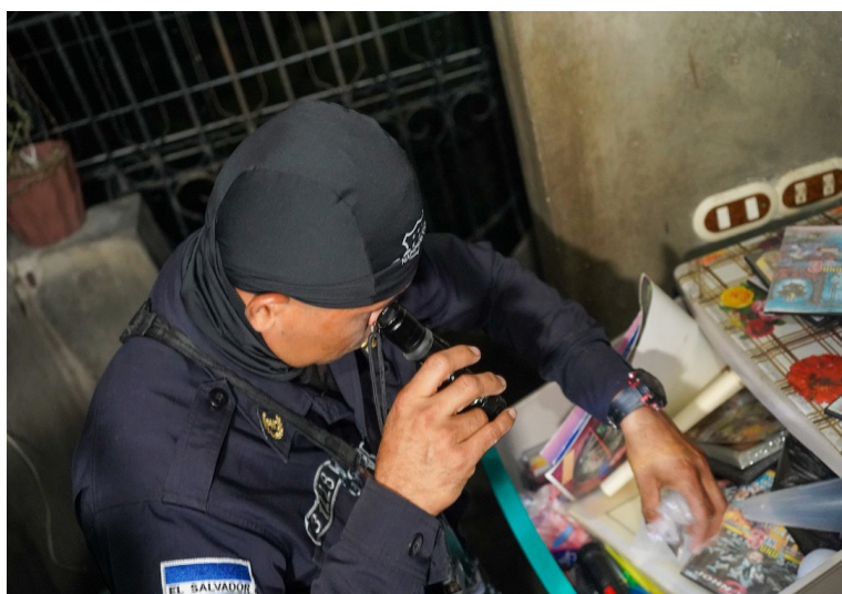
FGR y PNC montaron un operativo la madrugada de este viernes para capturar a sujetos que se dedican a la comercio de drogas.