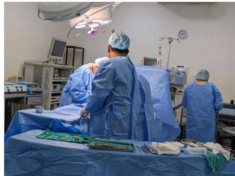
Con fondos propios SIMETRISSS finaliza la primera fase del proyecto Reducción de Mora Quirúrgica, para beneficiar a los pacientes que esperan ser operados.

“Como directivos y afiliados a SIMETRISSS agradecemos por el apoyo dado al proyecto, ha sido un gran esfuerzo, pero estamos para cumplir con las demandas y necesidades de la población beneficiada. La fase uno fue de peque-