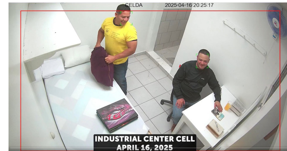
Nayib Bukele muestra fotografías y videos donde se ve a García recluido en un centro de detención. Pero según las mismas imágenes no es el CECOT.

Abrego García “fue sometido a torturas físicas y psicológi-