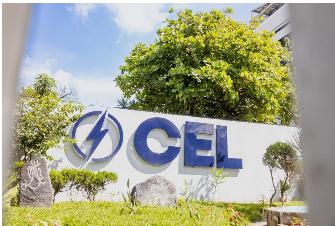
La Asamblea Legislativa autoriza que la Comisión Ejecutiva Hidroeléctrica del río Lempa (CEL) emita títulos valores por $580 millones.

La Asamblea Legislativa, de mayoría oficialista, autorizó que la Comisión Ejecutiva Hidroeléctrica del río Lempa (CEL) emita títulos valores por $580 millones.