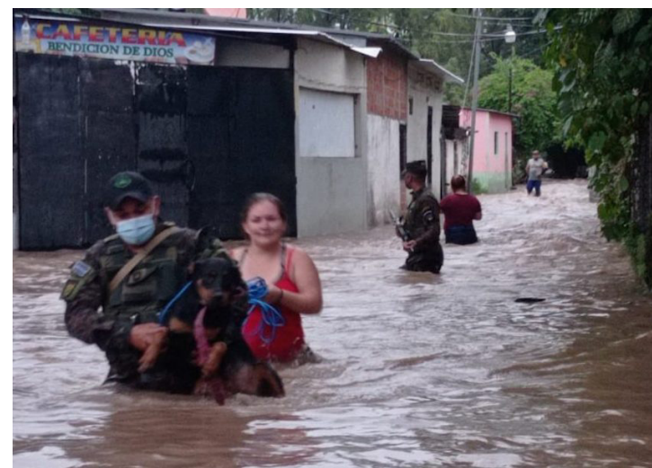
La MPGR recomienda al gobierno la importancia de la creación de políticas públicas que salvaguarden la vida, la integridad física y los bienes de la población que se ve afectada por estos fenómenos climáticos.

“Se requiere la adopción de medidas integrales para hacer frente a tales condiciones, y superar medidas paliativas y aisladas que implican el desgaste