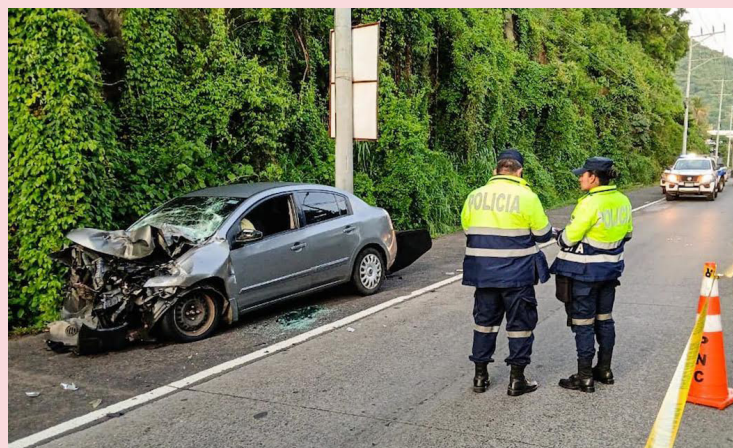
El conductor de un vehículo falleció y dos acompañantes resultaron lesionados, en un accidente de tránsito en el kilómetro 14 de la autopista Comalapa, Santo Tomás, San Salvador.

La Policía Nacional Civil (PNC) informó que, de acuerdo con las primeras investigaciones, el conductor manejaba ebrio, dos personas que lo acompañaban fueron trasladadas a un hospital debido a las lesiones. En otro hecho, un pickup y un vehículo particular chocaron en la carretera hacia Metapán, caserío Las Casitas, el incidente solo dejó daños materiales. Asimismo, un accidente vial se registró en la 49ª avenida Sur,