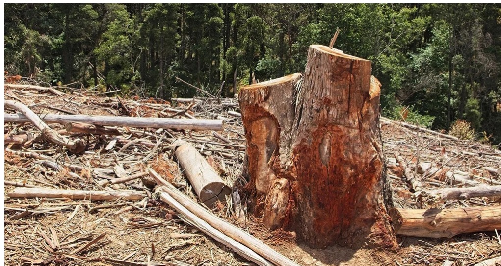
Entre las causas más graves de que este deterioro este presente en el país, están la tala indiscriminada de árboles en la construcción de megaproyectos.

temperatura tiene impactos graves y acelerados, dijo Navarro, como fenómenos extremos más frecuentes lo cual ocasiona pérdida de biodiversidad, y mayor vulnerabilidad humana y ecológica”, agregó.