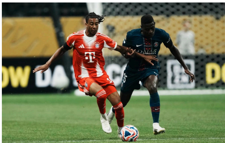
El PSG vence 2-0 al Bayern en los cuartos de final del Mundial de Clubes 2025.