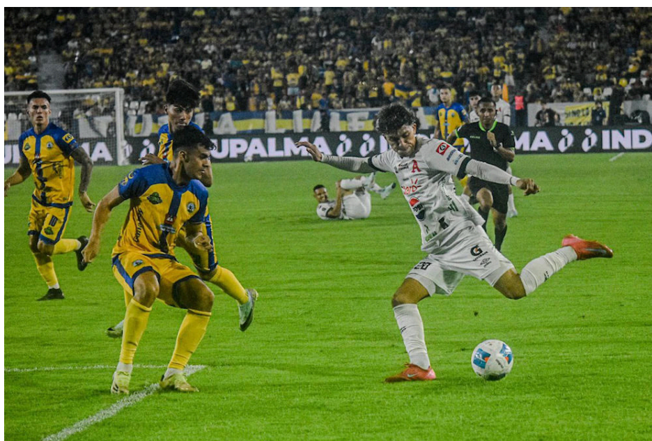
El Apertura 2025 arrancará con 12 equipos en la liga dorada.

gundo, se jugará en la jornada 15 el sábado 4 o domingo 5 de octubre.