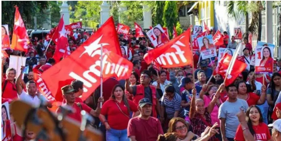
El FMLN desarrollará su congreso nacional en tres meses donde se desarrollan debates del presente y futuro del partido y del país.