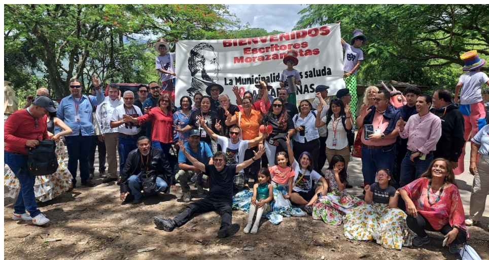
El IV Encuentro de Artistas y Escritores Morazanistas “Relámpago que Siembra”, reúne a artistas y escritores centroamericanos y del continente.

Con este encuentro los participantes han manifestado su satisfacción, y agradecimiento a los organizadores por el trabajo arduo y constante, y se comprometen a dar seguimiento, formación y sobre todo honrar la memoria de Francisco Morazán, y destacar en cada pueblo, el valor de hombres y mujeres, que a lo largo de la historia han contribuido al desarrollo y crecimiento de las naciones del Norte, Sur y Centroamérica.