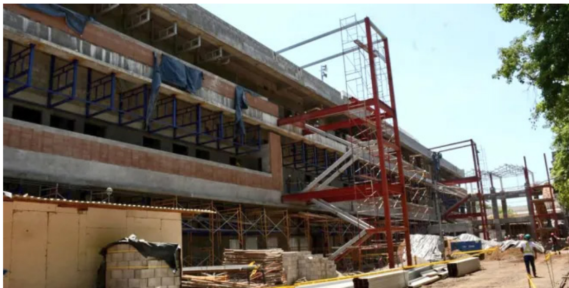
Asamblea aprueba que se elimine el requisito de parqueo en construcciones de viviendas.

construcciones de viviendas a personas de escasos recursos y quitarles impuestos a constructoras que realizan viviendas populares.