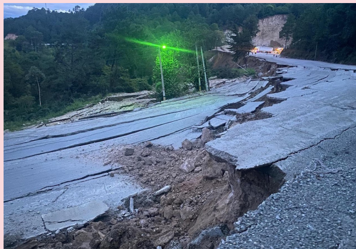
El paso desde Honduras hacia la frontera El Poy, en Chalatenango, se encuentra cerrado debido al hundimiento.

El tramo afectado fue completamente cerrado y las autoridades advirtieron sobre el riesgo de nuevos deslizamientos. Mientras, persiste la preocupación por el impacto en el comercio y el acceso a servicios básicos, sobre todo, para las comunidades que resultaron incomunicadas.