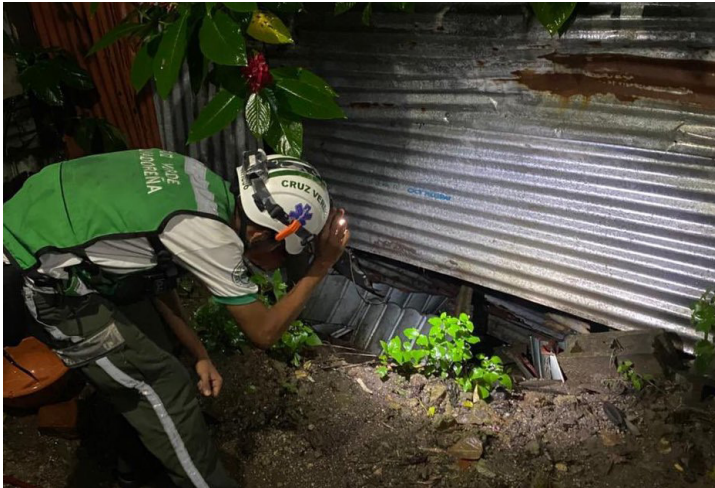
Cruz Verde reporta el derrumbe de vivienda en la Cooperativa El Espino, barrio Chino, en Antiguo Cuscatlán, debido a las lluvias de las últimas horas.