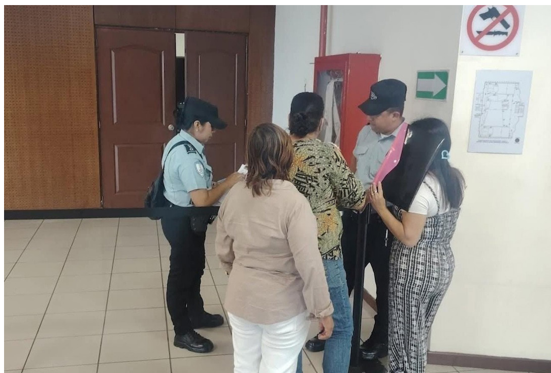
Momento en que padres de familia llegan a la audiencia.

“Los delitos creo que todo el mundo lo conoce, hay una reserva de este proceso y básicamente son 14 buenos estudiantes, jóvenes deportistas, jóvenes emprendedores, que lastimosamente tienen un señalamiento como partícipes de pertenecer a una estructura delincuencia, lo cual esta defensa considera que no es cierto”, comentó uno de los abogados. A juicio del abogado esta acusación es “un rencor de algún joven o alguna envidia de alguno de los amigos o compañeros de ellos que los ha seña-