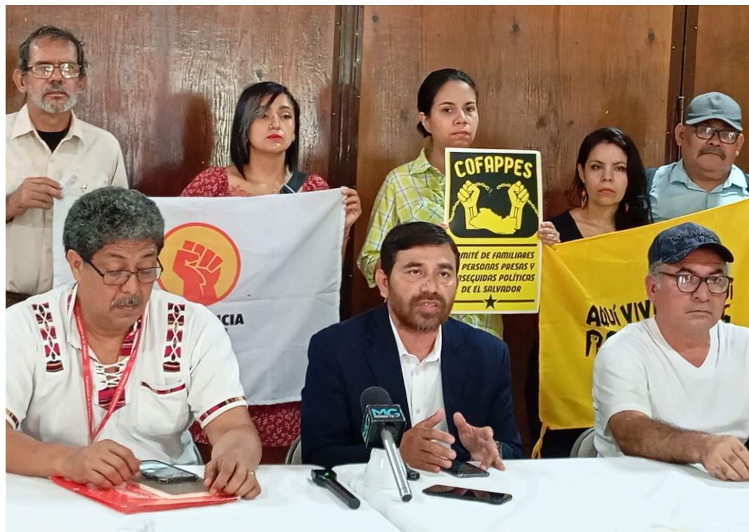
Organizaciones sociales denuncian que durante 30 meses los cinco líderes de ADES Santa Marta, han sido criminalizados y perseguidos, por de defensa del medioambiente.