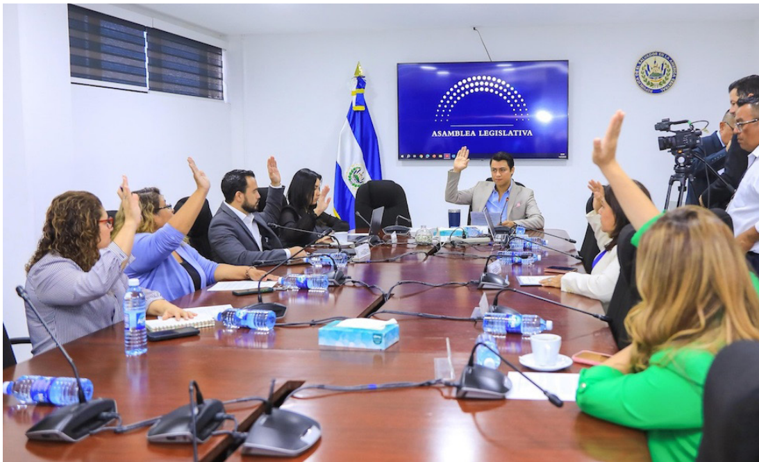
Momento en que la Comisión de Hacienda vota a favor de reformar el presupuesto 2025 para incorporar recursos.