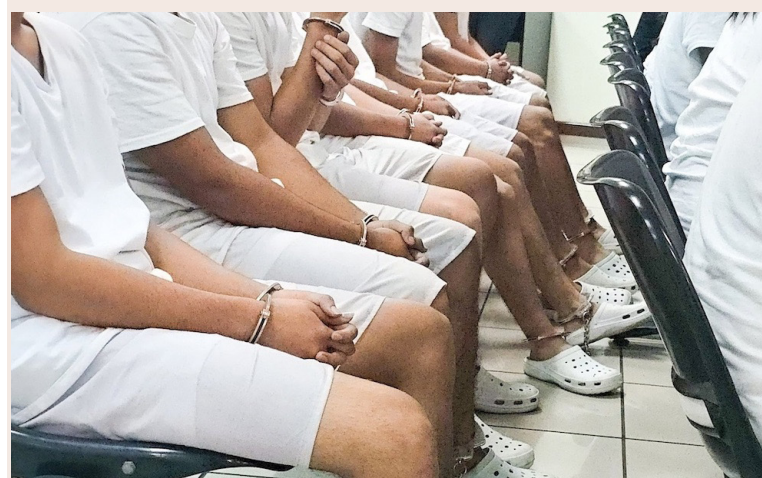
Los estudiantes y ex estudiantes de diferentes institutos públicos seguirán en prisión mientras continúan las investigaciones por presuntamente intentar reactivar una pandilla estudiantil.

necesidad y les dije algo claro: no están solos. Les pedí que evaluaran cuánto necesitan para reconstruir su local y me comprometí a apoyarles con el 100% de ese monto”, dijo Aragón.