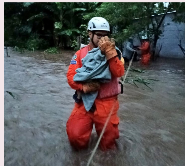
De forma preventiva una familia fue evacuada en la colonia Primavera, Chalatenango, debido al incremento del caudal del río Tamulasco.

El Ministerio de Medio Ambiente y Recursos Naturales (MARN) prevé para la mañana de este martes, que el cielo se mantendrá parcialmente nublado sobre la cordillera volcánica y la zona norte, sin lluvias esperadas. “Por la tarde, el cielo estará parcialmente nublado sobre la cordillera volcánica y la zona norte, mientras que, en el resto del país estará poco nublado. Se prevé muy baja probabilidad de lluvias puntuales en la cordillera Apaneca-Ilamatepec y en la zona norte de Santa Ana”, informó el MARN.