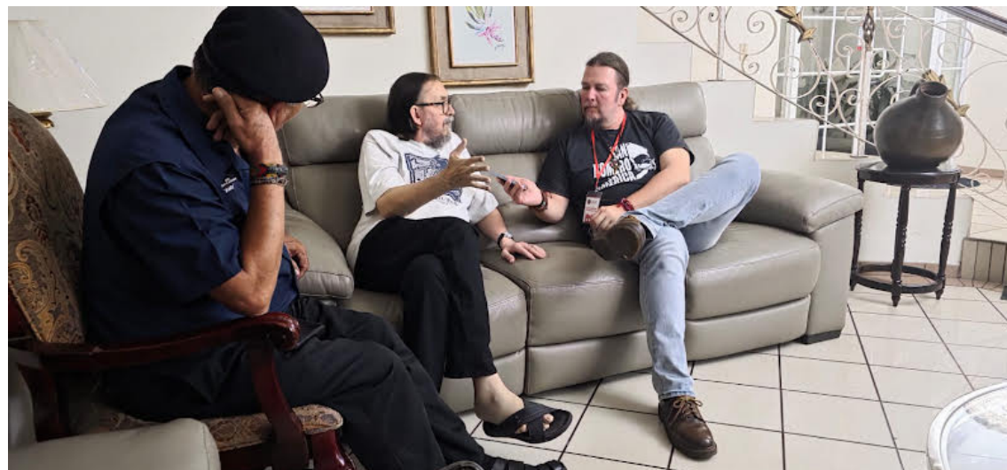
Entrevista concedida por Sergio a Puntos de Encuentros.

Freire es considerado uno de los pensadores más notables en la historia de la pedagogía a escala mundial, un referente hasta estos tiempos para entender el desarrollo de los sistemas educativos, y cómo entender muchas cosas que a pesar de conocerse se si-