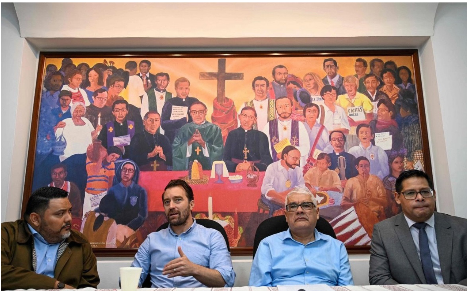
QUE CIRCULA REDES SOCIALES.