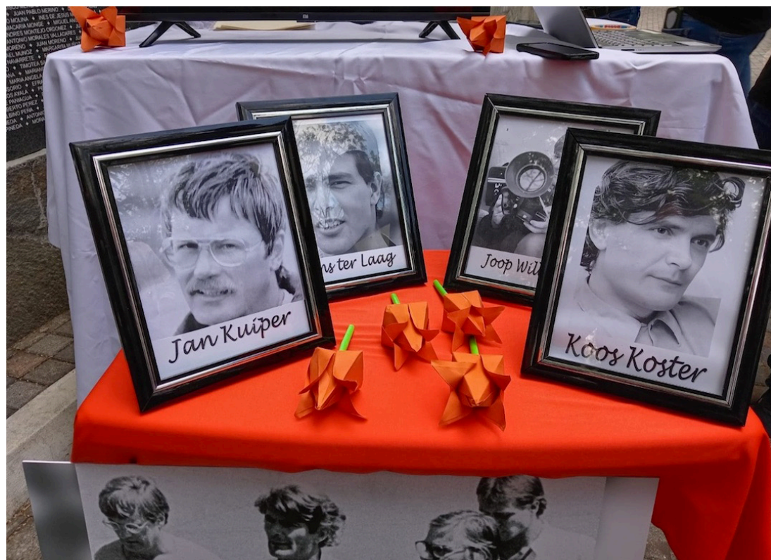
En el caso del asesinato de los cuatro periodistas holandeses, la FGR y abogados de los militares presentaron un recurso de apelación para anular el veredicto.

Sin embargo, en la sentencia se detalla que, conforme al Código Penal vigente en 1973-1974, la pena máxima efectiva por el delito de asesinato era de 30 años, por ello, cada uno de los militares condenados cumplirá 30 años de prisión efectiva.