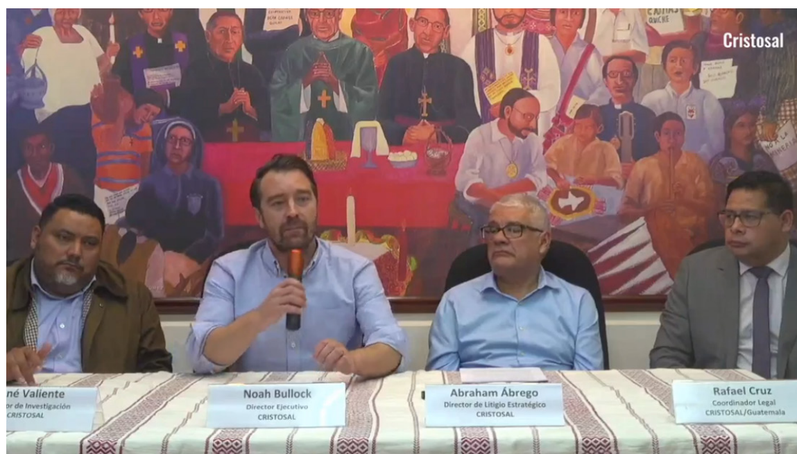
Cristosal suspenderá operaciones en El Salvador debido a la escalada represión de parte de El Salvador en contra de personas defensoras de DDHH.