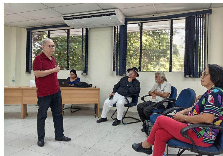
Los poemarios presentados en esta ocasión tienen una amplia investigación, y acabado poético, abordando la temática ancestral e Indígena de nuestro país.

Los poemarios presentados en esta ocasión tienen una amplia investigación, y acabado poético, abordando la temática ancestral e Indígena de nuestro país. El autor dice que busca con sus obras el rescate de la memoria y la historia, temas que no deben dejarse de lado, y desde la investigación académica, la poesía se debe aportar en estos tiempos para dejar testimonio de nuestra identidad.