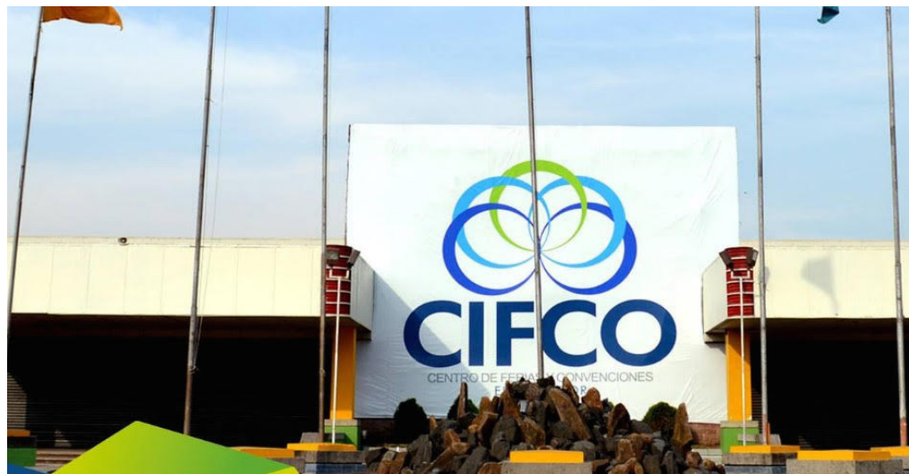
Las instalaciones del CIFCO fueron ocupadas para el Hospital El Salvador para lo más árido de la pandemia.