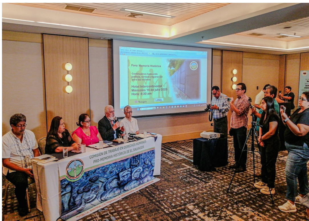
Organizaciones defensoras de Derechos Humanos muestran su preocupación ante la falta legislación en el tema de Justicia Transicional.

Es de ejemplificar que, desde el año 2021, todas las instituciones públicas