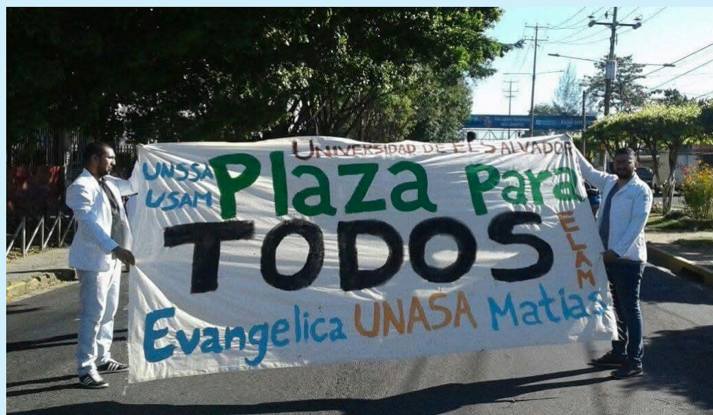
Los 271 estudiantes del séptimo año de medicina denunciaron que el examen, para optar a una plaza del internado rotatorio en un hospital público, fue redactado con preguntas fuera del contexto clínico.