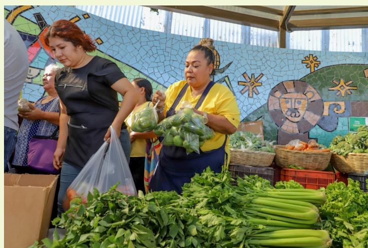
El Ejecutivo pide recortar $20 millones en el Ramo de Hacienda para asignarlos al MAG para el funcionamiento de los agromercados.

El Gobierno pide modificación a la Ley de Presupuesto 2025 en el ramo de Agricultura para asignar $20 millones “para continuar fortaleciendo la capacidad logística de abastecimiento de los agromercados a nivel nacional, los cuales permiten a los pequeños agricultores vender sus productos directamente al público; asimismo, promueven la interacción entre proveedores y consumidores sin intermediarios, ofreciendo productos frescos y de calidad a precios justos, empoderando a los productores y a sus familias”.