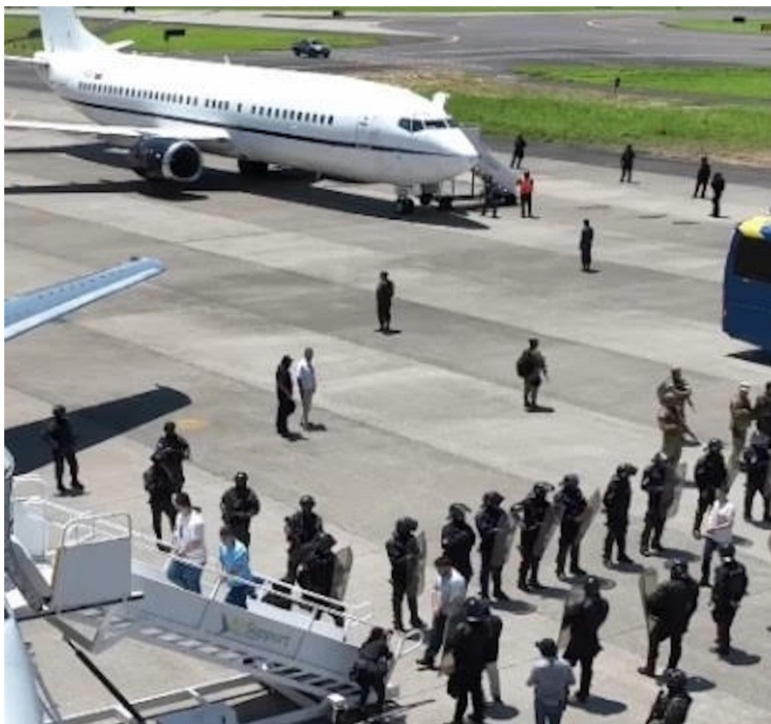
Momento en que son transportados los venezolanos detenidos en El Salvador hacia un avión con destino a Venezuela.

En El Salvador, fue el medio de comunicación de la Universidad Centroamericana José Simeón Cañas, Radio YSUCA, el primero en informar sobre las negociaciones y el canje de migrantes por prisioneros políticos, pues destacó que medios internacionales habían reportado que este viernes aterrizó en el Aeropuerto Internacional Simón Bolívar, de Maiquetía, en el estado de La Guaira, un avión modelo Gulfstream III, matrícula N173PA, vinculado a la Agencia Central de Inteligencia (CIA) de Estados Unidos. Según el medio, la aeronave habría llegado a Venezuela para repatriar a ciudadanos estadounidenses considerados “presos políticos”, que permanecían bajo custo-