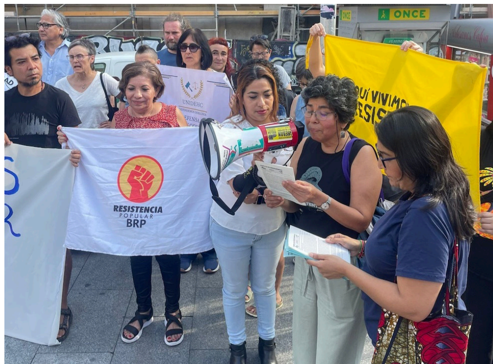
Salvadoreños y personas solidarias en el País Vasco se concentraron en una de las plazas de Bilbao, para denunciar las arbitrariedades y violaciones a derechos humanos del gobierno de Nayib Bukele.

Bajo el lema “Porque el silencio no es una opción, porque nos duele El Salvador”, el Comité de salvadoreños en Euskal Herria se concentró en una de las plazas de Bilbao, del País Vasco, donde se pronunciaron contra la política implementada por el gobierno del presidente Nayib Bukele.