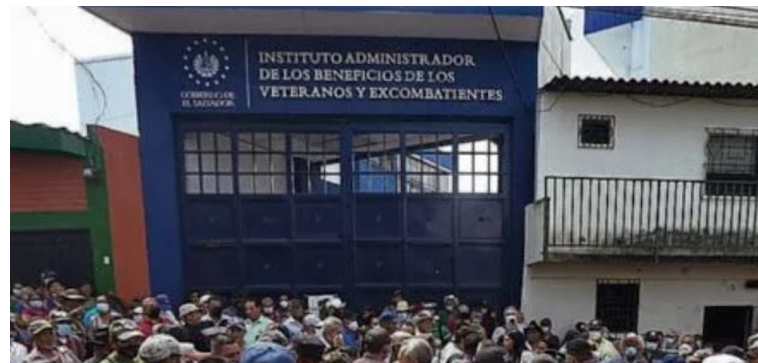
Veteranos y lisiados de guerra del FMLN piden al INABVE que respeten sus beneficios y los procesos institucionales.