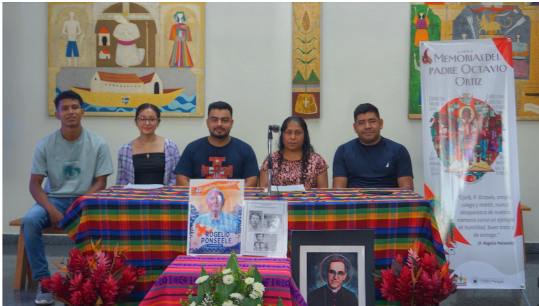
El asesinato del sacerdote Octavio Ortiz Luna, junto a cuatro catequistas, tuvo lugar el 20 de enero de 1979.