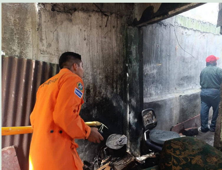
El incendio fue controlado con éxito y solo se reportaron daños materiales.

Las instituciones de socorro permanecieron en el área durante varias horas, realizando labores de enfriamiento, evaluación de daños y verificación de condiciones de seguridad. Las autoridades aún investigan las causas que originaron el incendio.