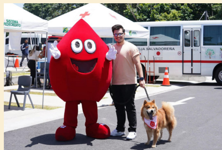
Muchos de los donantes altruistas llegaron acompañados de sus perros.

Entre los criterios establecidos se encuentran: tener