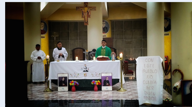
La homilía de Monseñor Romero del 17 de julio de 1977 está dedicada a la fuerza de la oración.

Como parte central de la liturgia, se ofrecieron el pan y el vino,