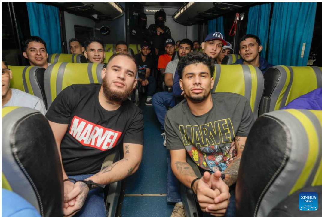
El 15 de marzo migrantes venezolanos fueron deportados desde Estados Unidos hacia El Salvador, acusados de pertenecer al "Tren de Aragua" sin comprobar su participación delictiva ni en Estados Unidos ni en El Salvador.