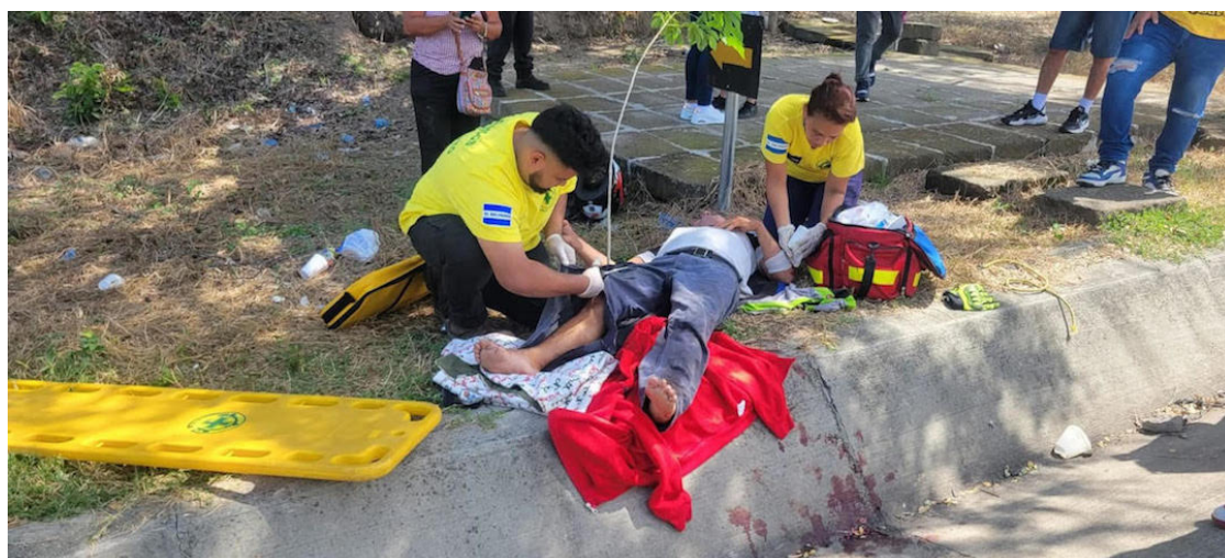
Los accidentes viales relacionados con motociclistas han aumentado un 28% con respecto al 2024.

Según datos oficiales, en lo que va del año se han registrado 11,452 accidentes viales. De estos, 7,719 han dejado personas lesionadas y 652 han fallecido. Entre las principales causas de siniestros viales se encuentra la distracción al volante.