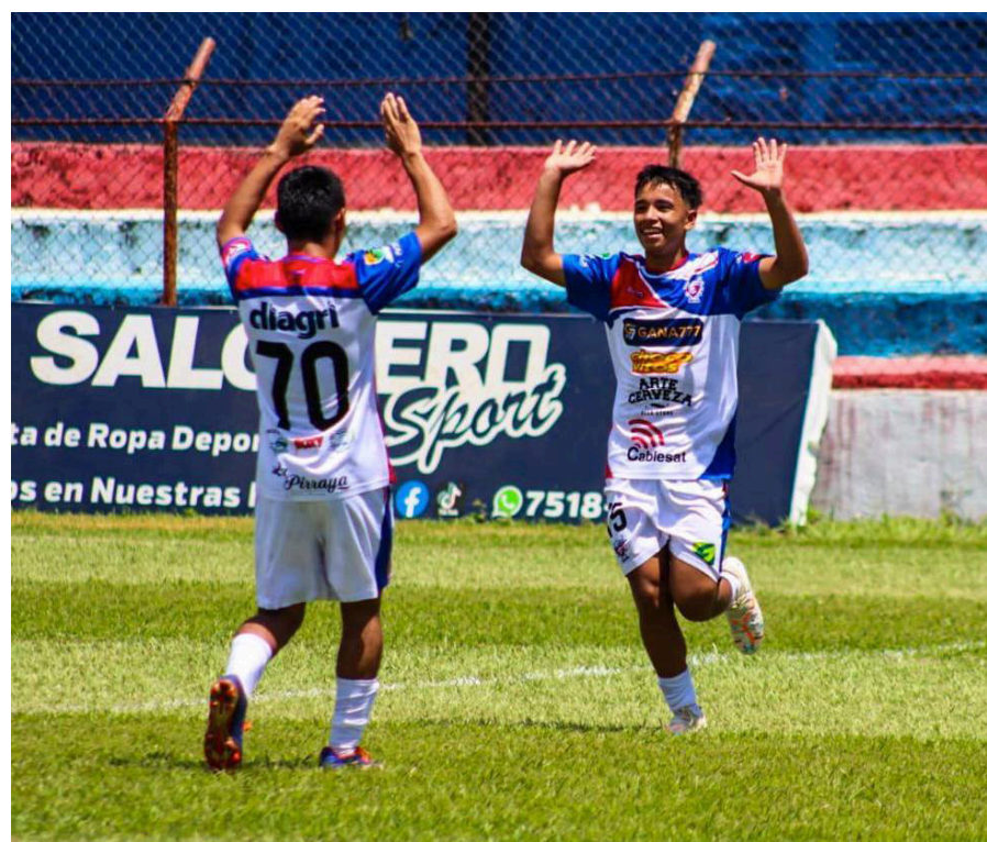
Jugadores de Luis Ángel Firpo celebra una de las anotaciones.