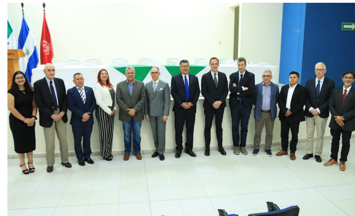
Los estudiantes también se preparan en áreas como geotermia, hidrogeología, vulcanología, sísmica y recursos naturales.

“Contamos con un entorno propicio para el desarrollo de amenazas naturales,