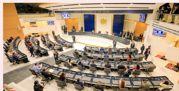
Asamblea Legislativa aprueba asignar $22 millones al MOP para financiar el programa Surf City Fase 1.

También, el oficialismo autorizó que la Comisión Ejecutiva Hidroeléctrica del Río Lempa (CEL) suscriba, en segunda vuelta, un contrato de préstamo por $93 millones con el Banco Inte-