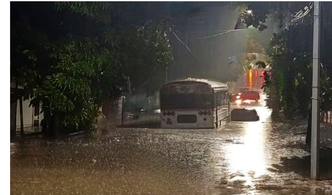
Las fuertes lluvias generaron una inundación en la colonia Sierra Morena, Soyapango. Un bus y varios vehículos fueron afectados al quedar en medio del agua.

nes, podrían continuar las lluvias en sectores del oriente y a lo largo de la costa, durante las tormentas, son posibles vientos fuertes momentáneos que superen los 45 kilómetros por hora