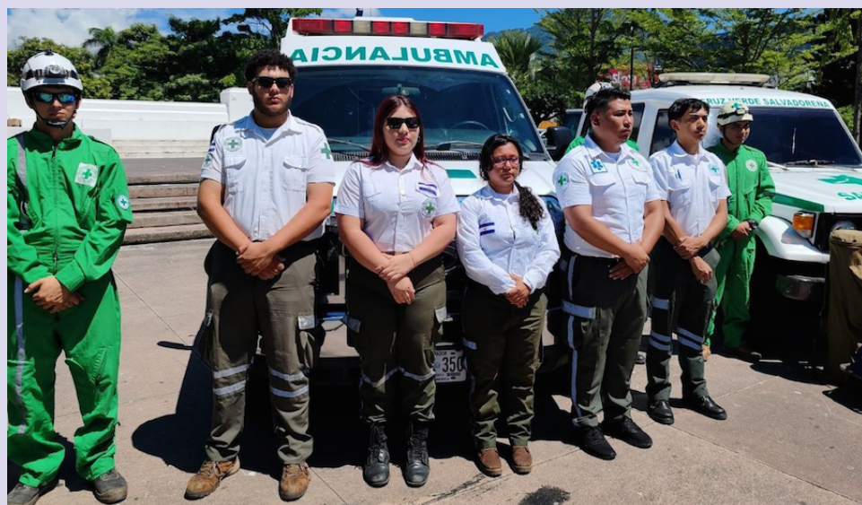
Para Cruz Verde Salvadoreña se debe estar atento a atender emergencias en esta temporada por la incidencia que se registran en el país.

como pueblo salvadoreño. Aquellos hermanos que no puedan asistir pueden sumarse virtualmente, siguiendo la transmisión a través de la televisión, la radio y las redes sociales católicas”, manifestó el religioso.