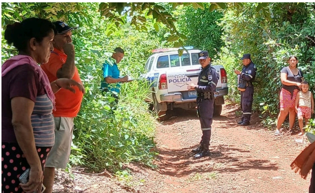
Agentes de la PNC irrumpieron en la comunidad La Lima, Intipucá, La Unión, para realizar una inspección ocular a las familias que habitan en el lugar.