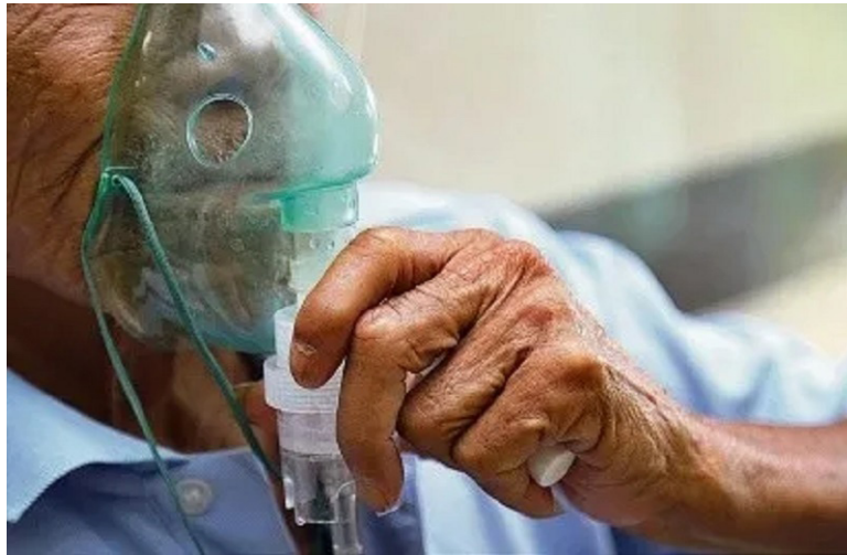
Las enfermedades respiratorias son un conjunto de afecciones que afectan el sistema respiratorio, incluyendo los pulmones, las vías respiratorias y los tejidos circundantes.

den variar desde infecciones agudas, como la gripe y la neumonía, hasta enfermedades crónicas, como el asma y la enfermedad pulmonar obstructiva crónica (EPOC).