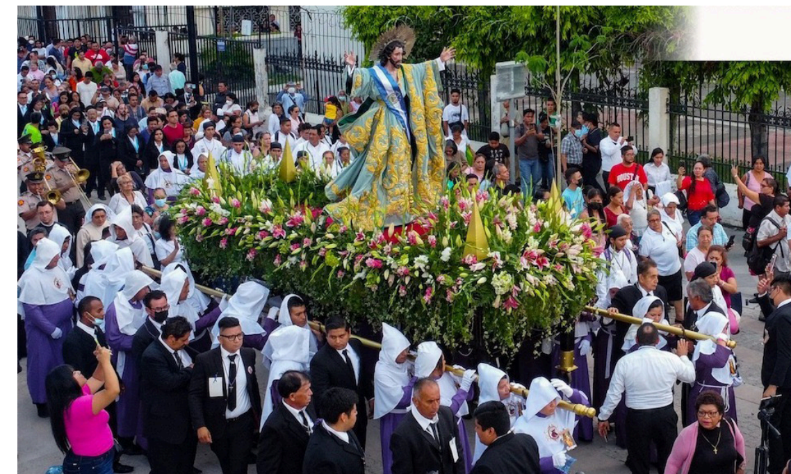
La iglesia católica invita a participar de las Fiestas Titulares en honor al Divino Salvador del Mundo 2025.

Después sale de la iglesia del Calvario hacia la Basílica del Sagrado Corazón de Jesús, donde la imagen permanece hasta las 3 de la tarde, a esa hora será las solemnes vísperas en honor al Divino Salvador del Mundo; seguidamente saldrá la procesión hasta Catedral Metropolitana, para la transfiguración del Señor, conocida popularmente como La Bajada. Cartagena detalló que el día 6 de agosto la gran solemnidad estará acompañada con la celebración del sacramento de la confesión, para todas aquellas personas que deseen acer-