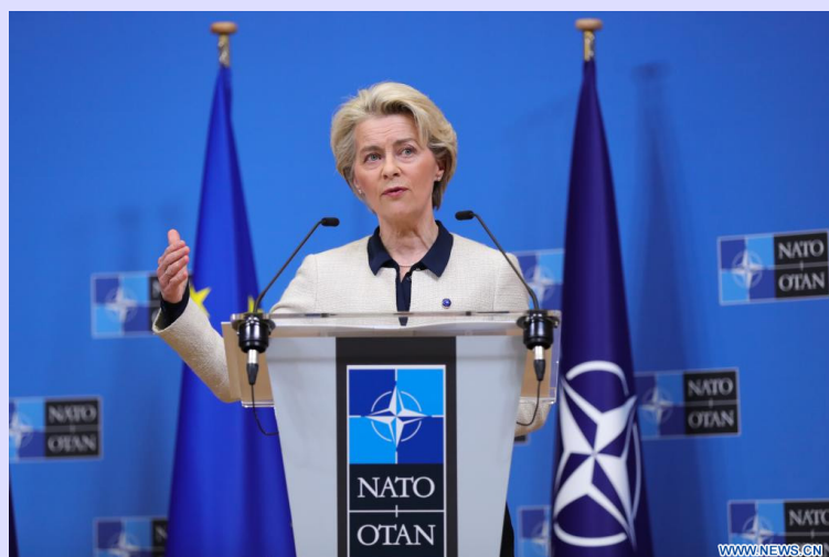
Ursula von der Leyen, presidenta de la Comisión Europea (Foto: Xinhua)

Von der Leyen indicó en una publicación en la red social X que los dos líderes tuvieron una “buena conversación telefónica” y acordaron reunirse en Escocia para “discutir las relaciones comerciales transatlánticas y la forma en la que pueden mantenerlas fuertes”.