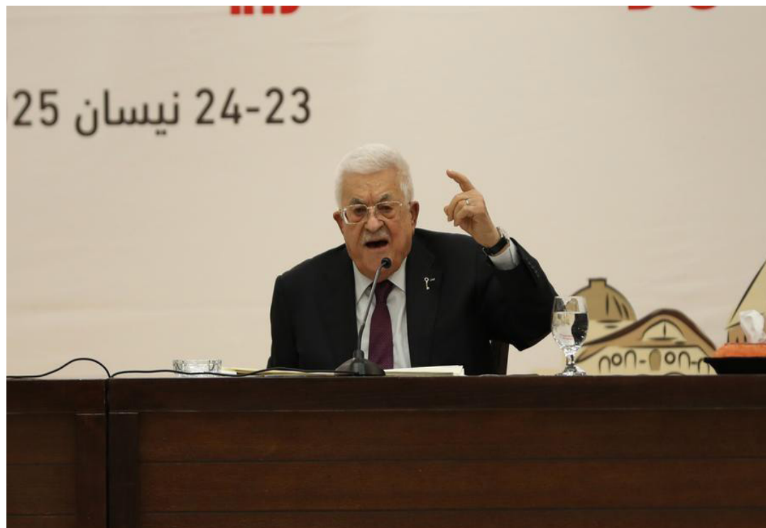
Mahmoud Abbas, presidente palestino

El presidente francés, Emmanuel Macron, anunció el jueves que Francia reconocerá oficialmente al Estado de Palestina durante el próximo 80º período de sesiones de la Asamblea General de las Naciones Unidas en septiembre.