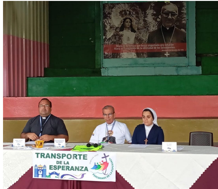
La iglesia católica anuncia para este 1 y 2 de agosto la octava peregrinación “Camino de Monseñor Romero”, para mantener viva la herencia del profeta y mártir.