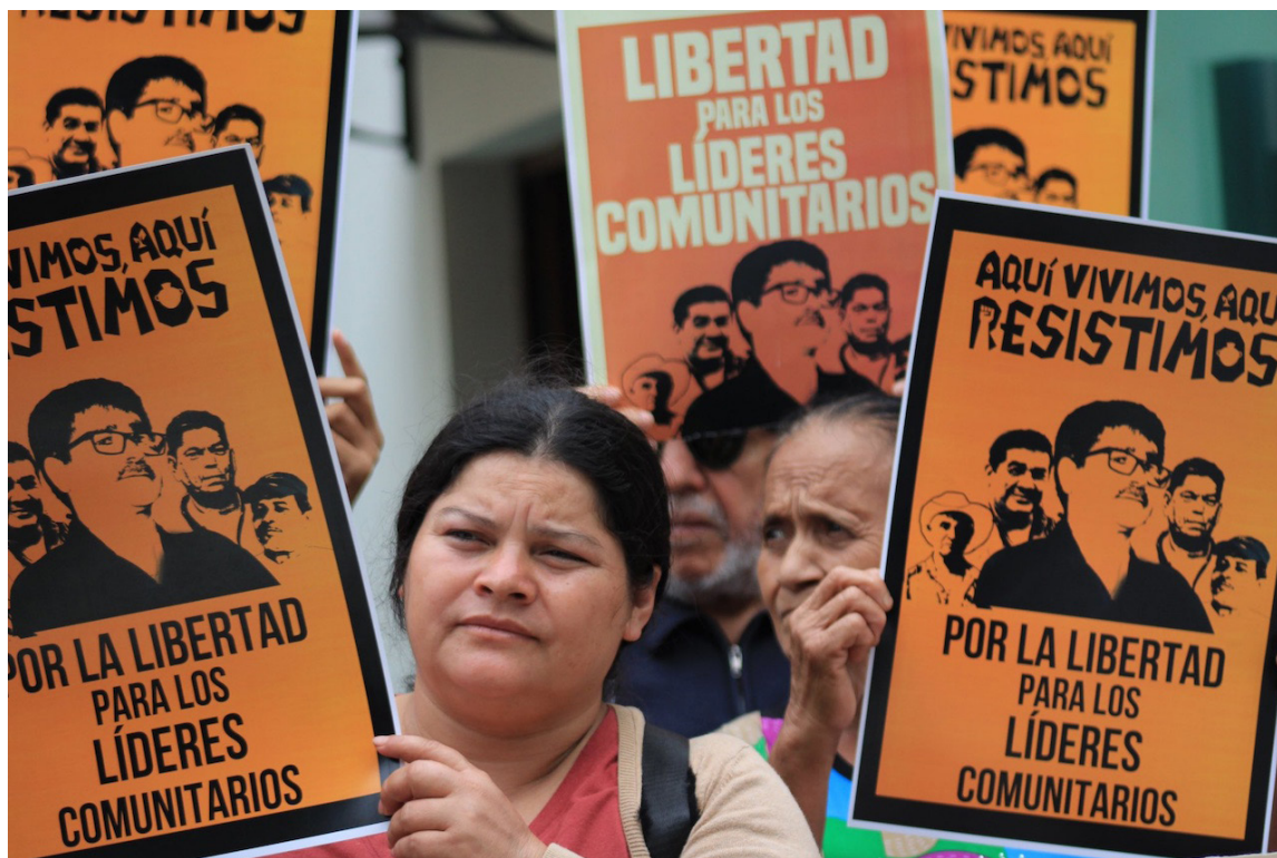
Movimiento social exige la liberación de los líderes ambientalistas quienes enfrentan la repetición de la vista pública por un supuesto asesinato durante la guerra.

“Desde el primer día, nosotros estábamos con esa tranquilidad de que la acusación que se ha presentado contra nuestros familiares no tenía ningún fundamento y ha quedado evidenciado en estos 30 meses en los que la fiscalía no ha sido capaz de presentar una