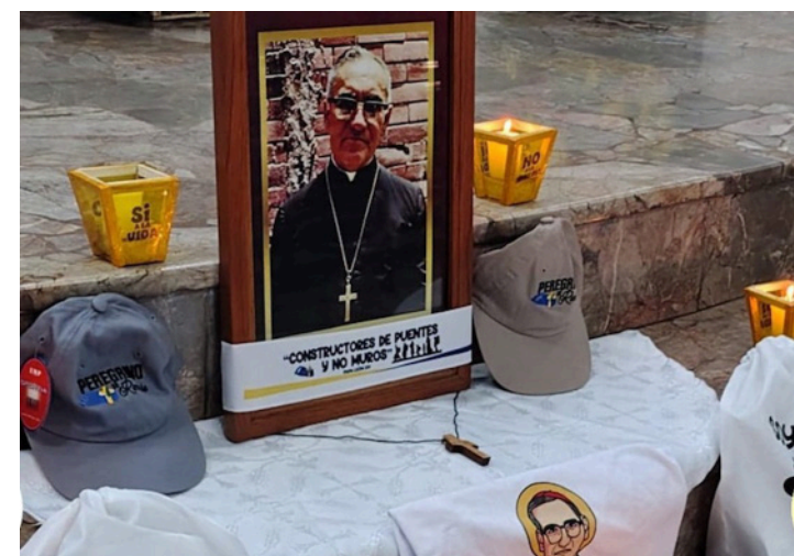
En el puente Cuscatlán, sobre el río Lempa se hará un acto especial en conmemoración de solidaridad con los migrantes.

En la inscripción se les entregará a los peregrinos un gafete color azul en el cual llevará los datos, si es alérgico a algo, padece alguna enfermedad o toma algún medicamento. Los sacerdotes que acompañarán la peregrinación llevarán un gafete color verde con la frase “sacerdotes de la esperanza”, quienes desean confesarse en el camino o en los lugares de descanso pueden acercarse a esos sacerdotes.