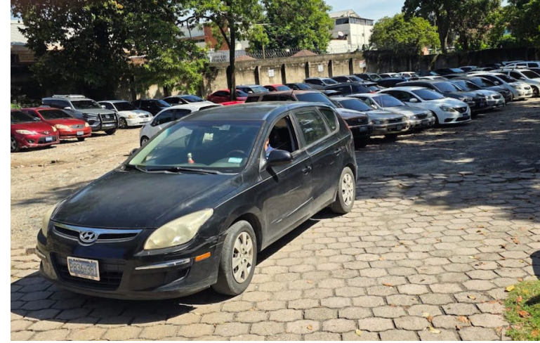
Pacientes del ISSS señalan la falta de parqueos en los hospitales y clínicas, la mayoría son utilizados por empleados.

A criterio de Aguirre, muchos de los pacientes que son atendidos en el Seguro Social son adultos mayores, o utilizan bastones, sillas de ruedas, mule-