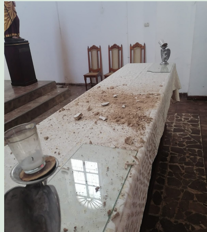
El fuerte sismo sentido la tarde del martes, dejó daños materiales en la parroquia de Santiago Apóstol, en Chalchuapa, Santa Ana Oeste.

Y esto se conoció en redes sociales cuando se hizo una publicación en la que se leía: “¡Hermanos! Nuestro Templo, icono de nuestra centenario fe, a sufrido daños que posteriormente evaluaremos a través de las autoridades competentes, mientras tanto pedimos precauciones al visitar este espacio sagrado y su oración por nuestra ciudad”. El Salvador es un país donde los temblores son comunes, la