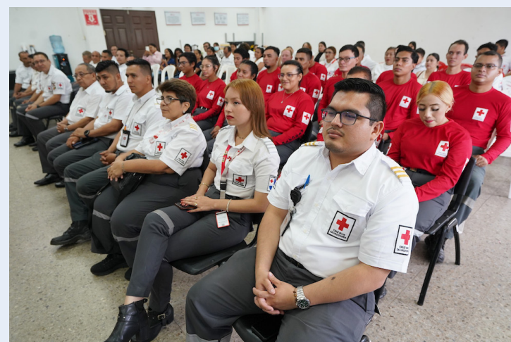
Los voluntarios se sometieron a pruebas y conocimientos de rescate vertical y vehicular, búsqueda y rescate en estructuras colapsadas y confinadas.

“Con estas capacidades, los nuevos rescatistas se suman a las labores humanitarias de la institución, fortaleciendo la respuesta ante emergencias, desastres y situaciones de crisis a nivel nacional”, destacó la Cruz Roja Salvadoreña a través de sus redes sociales. La Cruz Roja Salvadoreña es una institución humanitaria sin fines de lucro que forma parte del Movimiento Inter-