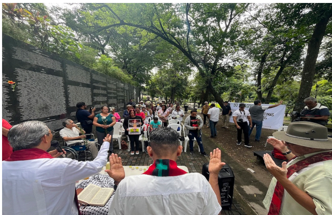
Frente al Monumento a la Memoria y la Verdad, familiares de víctimas del conflicto armado recuerdan a sus desaparecidos o asesinados con una vela y expresando sus nombres.

“Tales detenciones eran realizadas usualmente por sujetos vestidos de civil pertenecientes a Cuerpos de Seguridad o al Ejército. Por su parte, la Comisión de la Verdad para El Salvador, en su informe de