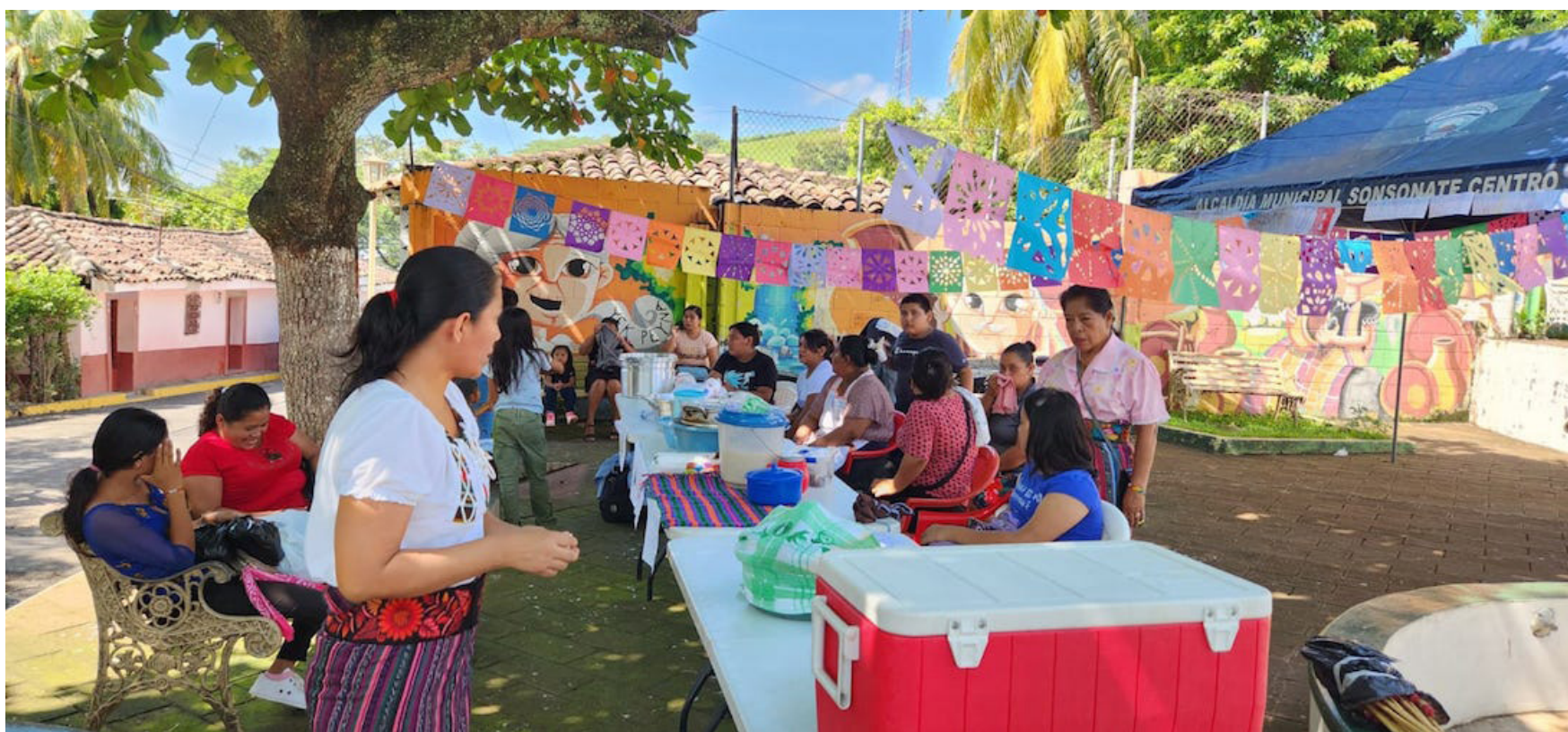
PROVIDA apoya los esfuerzos por revitalizar el náhuat pipil a través de su proyecto Fomentando el Desarrollo Local Sostenible.