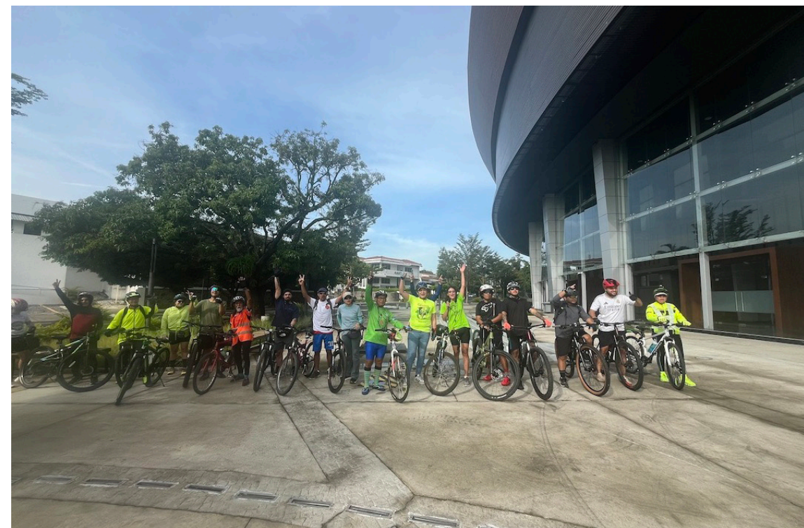
Miembros del movimiento ciudadano "Todos Somos El Espino" participa en una pedaleada que sale desde el Gimnasio Nacional José Adolfo Pineda hasta el Parque Bicentenario.