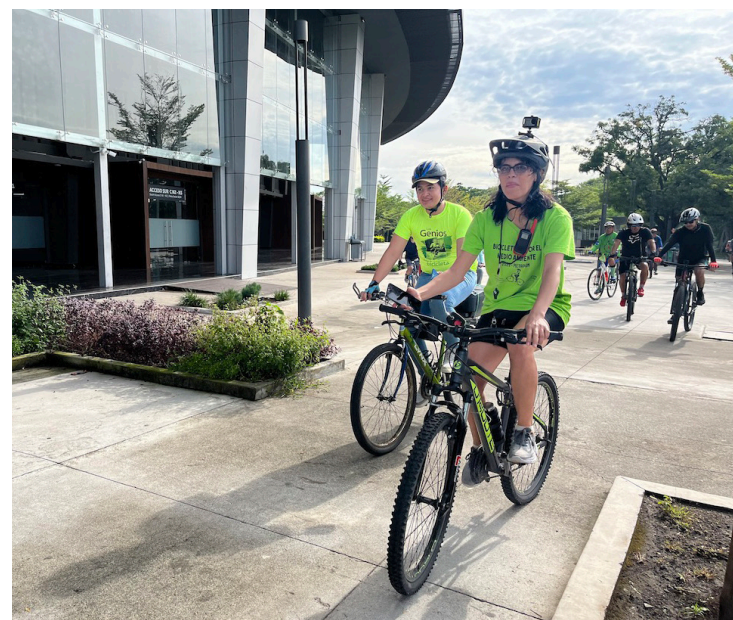
Los participantes hacen esta pedaleada como un llamado al Gobierno y evitar que se construya el CIFCO en una parte de la Finca El Espino.

"El cemento no puede silenciar el canto de los pájaros, el cemento no puede robarnos el aire que respiramos ni la sombra que nos protege. Defender el Espino es defender la salud de nuestras familias, nuestra identidad y el derecho humano a un ambiente sano", concluyó Méndez.