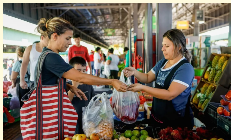
Dentro del presupuesto 2026, el MAG contempla el presupuesto para los agromercados que se encuentran a escala nacional.