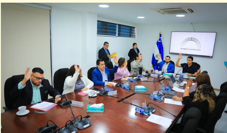
La Comisión de Hacienda dictamina a favor de asignar $7 millones al presupuesto de Educación provenientes de préstamos.