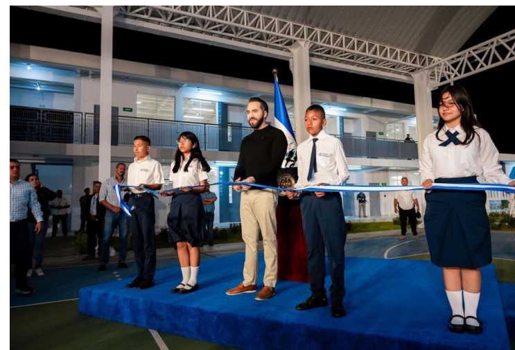
El pasado 2 de noviembre, Nayib Bukele inauguró 70 escuelas, pese a que su promesa en septiembre de 2022 fue la construcción de mil centros educativos al año.

Durante la inauguración de las 70 escuelas el pasado 2 de noviembre, Bukele reiteró que ningún gobierno anterior construyó 70 escuelas y, ahora, en un solo día, de forma simultánea, fueron entregadas dicha cantidad, que forman parte del programa