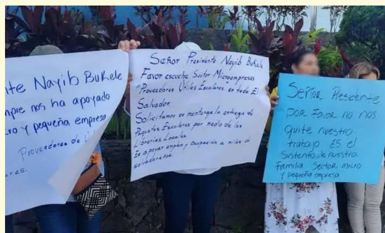
Los proveedores de útiles escolares fueron excluidos de las licitaciones para los paquetes del año 2026, pese a que habían sido notificados de las escuelas adjudicadas.

construcción 254 escuelas más. Las 70 escuelas que estamos entregando, más las 254 que están en construcción, hacen un total de 324 escuelas, al día de hoy", dijo el mandatario en cadena de radio y televisión.