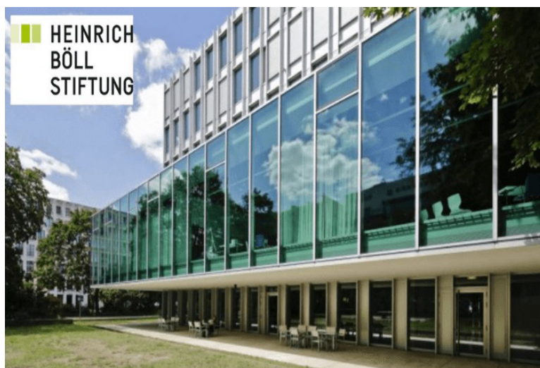
El FMLN condena el bloqueo de Estados Unidos en contra de Cuba, el cual ya tiene más de 60 años.

El traslado de su sede en Centroamérica será a Guatemala, aclara, y reafir-