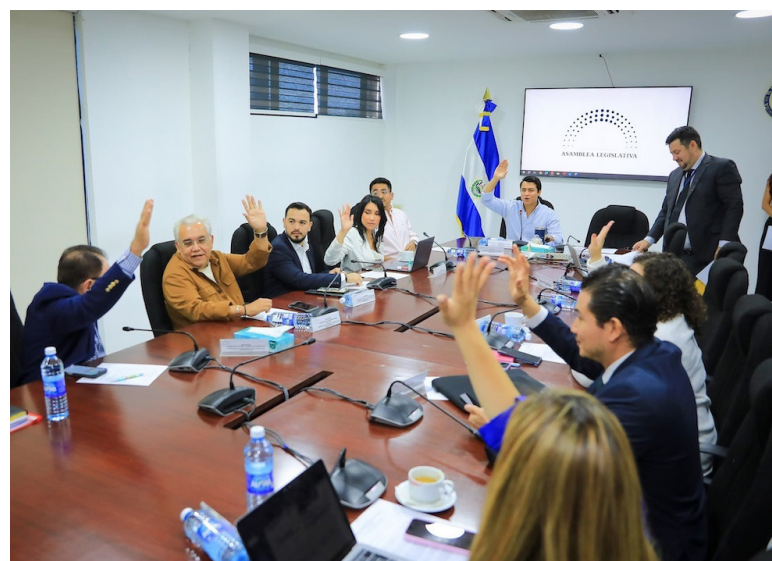
El dictamen pasará al pleno legislativo este martes 2 de diciembre para su aprobación sin especificar para qué serán utilizados.

transferir los fondos a la Dirección de Obras Municipales (DOM) para que esta entidad pueda realizar obras a escala nacional. pero muchas comunidades han puesto de sus bolsillos para arreglar sus calles, ya que el Gobierno y la DOM los ha ignorado.