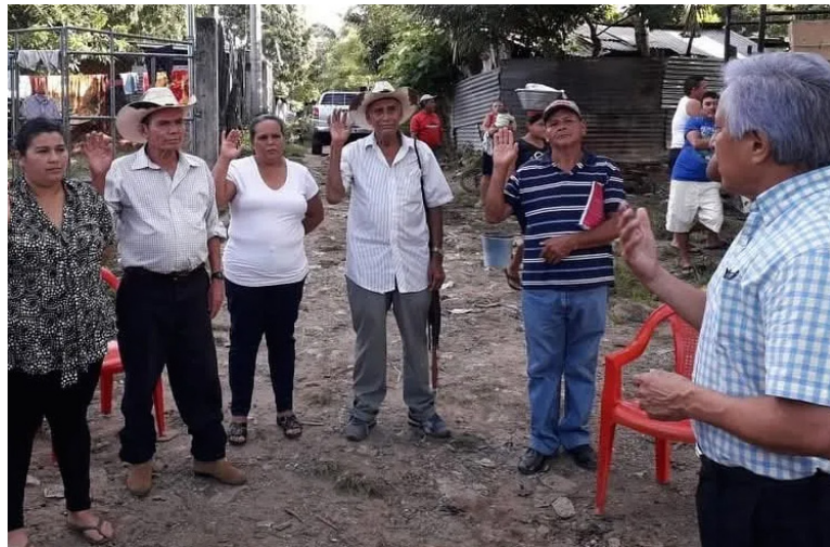
Las ADESCOS estarán sujetas al CNR y no con las alcaldías aunque seguirán supervisando a estas asociaciones comunales.

ros, habría “una visión única” desde el Código Municipal, porque se estandarizarían los procedimientos que actualmente son diferentes por cada ordenanza municipal. Eso le daría “seguridad jurídica” a cualquiera de las personas que forman parte de una asociación comunal.