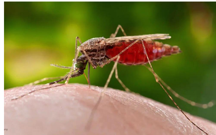
El zancudo Anopheles, transmisor de la malaria tiene otro tipo de reproducción, la enfermedad es 30% más mortal que el dengue.

“Todos han recibido tratamiento médico oportuno y están fuera de peligro. Es importante destacar que no representan riesgo para la po-