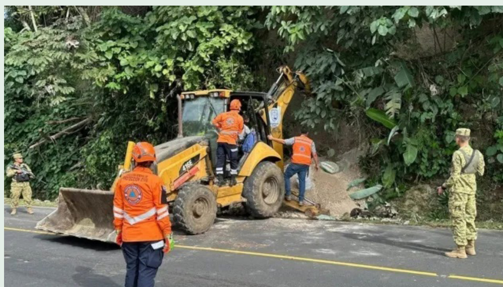
Abel Arturo Sigüenza, de 35 años murió soterrado tras el colapso de un talud en la carretera que conduce hacia Ataco.

mente que las 4 personas estaban sacando cascajo para un vivero de la zona, en la Ruta de Las Flores, en el sen-