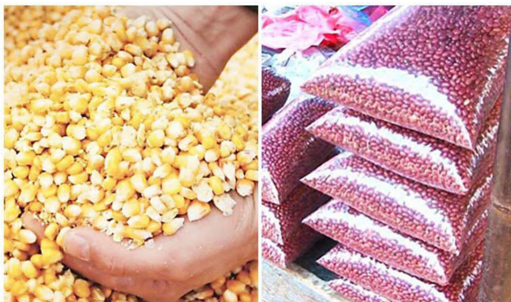
Para este año el déficit de granos básicos será del 25%, el déficit de maíz es de casi 5 millones de quintales y 375 mil quintales de frijoles.

CAMPO hizo un llamado a las autoridades, para hacer un consenso con las asociaciones y si existiera mayor coordinación, se pudiera economizar más y los recursos llegarán a una mayor cantidad de productores.