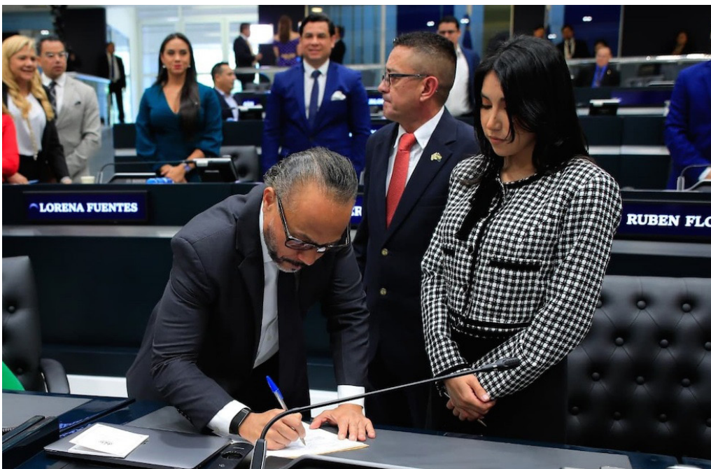
Momento en que los legisladores de Nuevas Ideas hacen fila para firmar la iniciativa de reforma a la Carta Magna, ya que para que sea conocida debe ser por lo menos con 10 firmas de legisladores.