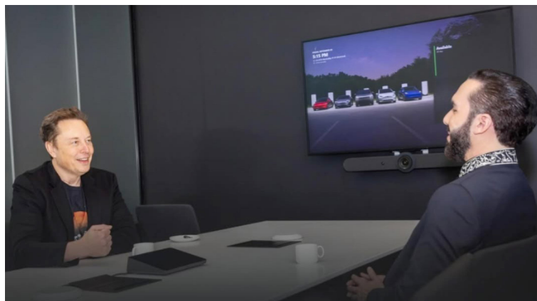
Bukele y Musk anunciaron un programa que utilizará la IA para tutorías en las escuelas públicas.

Bukele comentó que los beneficios del uso de la Inteligencia Artificial dependerá de la determinación con la que las personas lo usen ya sea para el “florecimiento” o la destruc-