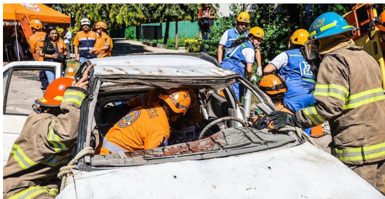
Protección Civil lleva a cabo un simulacro de accidente de tránsito, sobre el bulevar Monseñor Romero, con objetivo de fortalecer la capacidad de respuesta ante este tipo de emergencias durante las festividades de Navidad y Año Nuevo.

Asimismo, hizo un llamado a no conducir en estado de ebriedad y dar un mantenimiento a los vehículos, para evitar incidentes, revisar motor, fluidos hidráulicos, sistema eléctrico, porque muchos de los accidentes son por falta de mantenimiento. Entre tanto, Luis Amaya, director