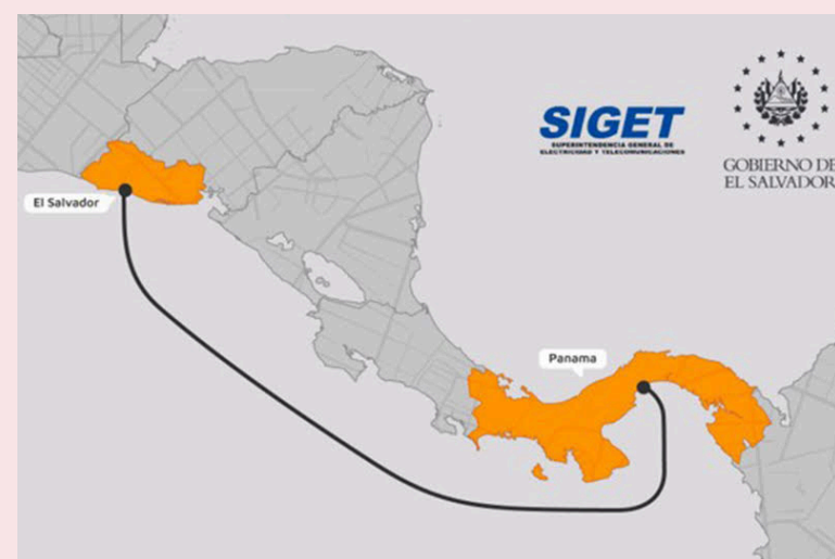
La SIGET habría seleccionado a la empresa Liberty Networks para que actúe de proveedor para el diseño, construcción, despliegue y operación del primer cable submarino en el país.

Liberty Networks dijo contar con la experiencia en la gestión de sistemas submarinos de alta complejidad y esto será clave para garantizar el despliegue y operación a largo plazo. El nue-