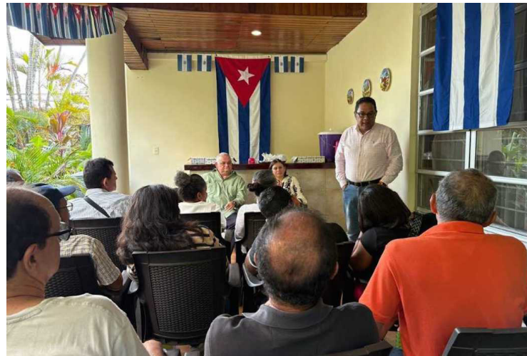
Diferentes grupos de solidaridad con Cuba en El Salvador manifestaron en 2025 su irrestricto apoyo al pueblo cubano y a su resistencia contra el bloqueo estadounidense.

Un destaque especial en el balance fue el apoyo económico y el esfuerzo durante meses de todas las expresiones de la solidaridad y de los médicos graduados en la Escuela Latinoamericana de Medicina (ELAM), lo cual resultó en el envío a Cuba de un